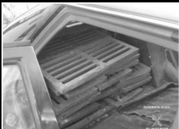
- Las tapas de alcantarilla en el vehículo del supuesto autor del hurto -

■ La Guardia Civil detiene al presunto autor del hurto de 17 tapas de alcantarilla del Polígono Industrial del Sequero. Efectivos de la Guardia Civil, pertenecientes al Puesto de Agoncillo, detuvieron el 3 de agosto a un varón de 34 años, natural de Venezuela y vecino de Agoncillo, como presunto autor de un delito de hurto. Los hechos que motivaron a esta detención fue una denuncia presentada por el hurto de varias tapas de alcantarilla del Polígono Industrial del Sequero. Durante la madrugada del 1 al 2 de agosto se sustrajeron 17 tapas de alcantarilla. Los agentes siguieron al sospechoso al salir de casa, que se montó en un coche, y comprobaron que la amortiguación era muy baja, por lo que fue interceptado. Tras identificarlo, se inspeccionó el interior del turismo, hallando en su interior 17 tapas de alcantarilla.