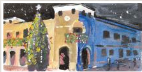
Ulises Franco Domínguez

Domingos y festivos: 12 a 14 horas (cerrado 25 diciembre y 1 de enero)